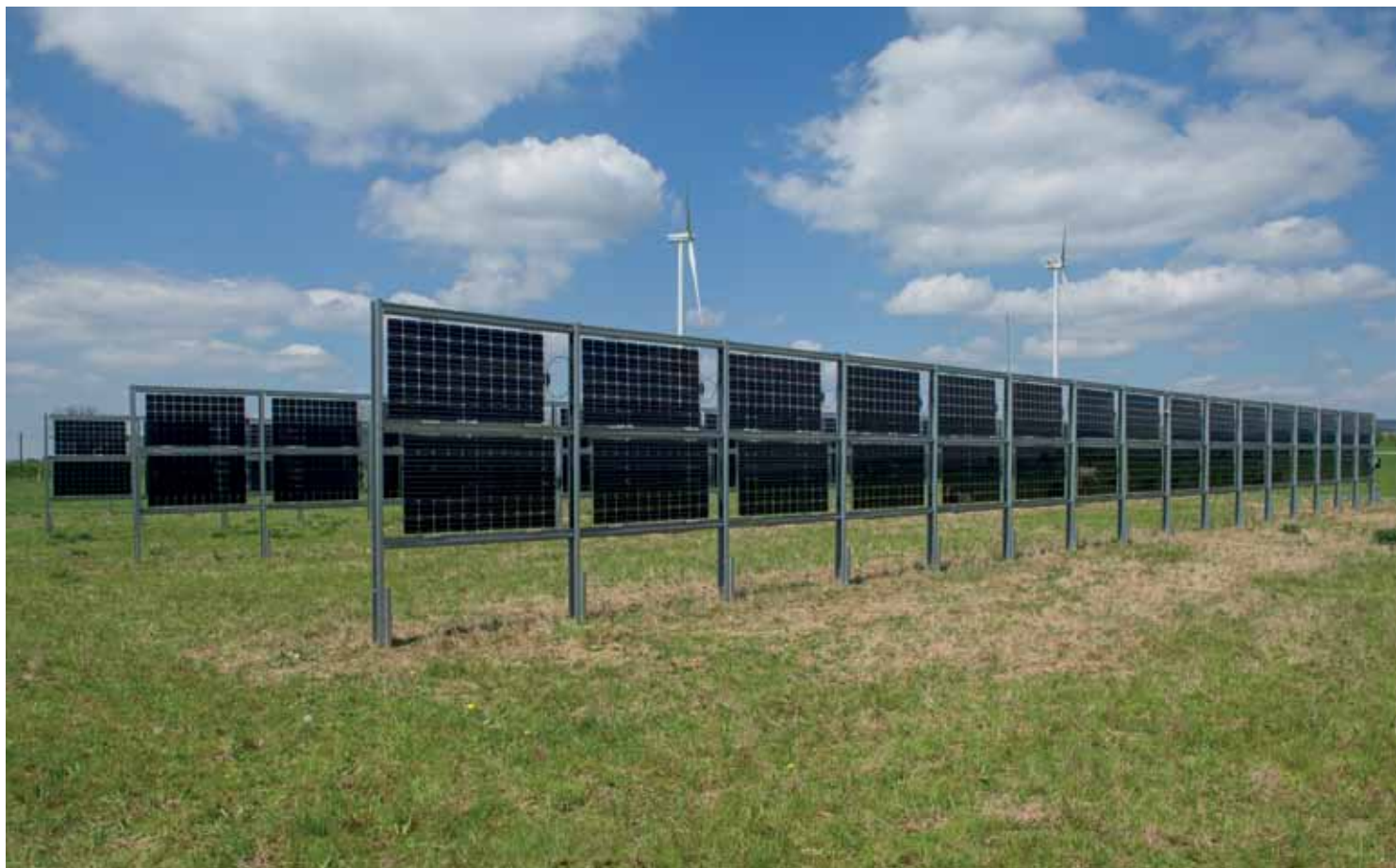
Diese Anlage mit senkrecht aufgeständerten Modulen hat eine Leistung von 28 Kilowattpeak und wurde 2015 errichtet.

man es gegen ein bifaziales Modul aus, verdoppelt sich dieser Ertrag, aber nur, wenn die Rückseite genauso effizient wäre wie die Vorderseite. Zusätzlich muss man den Ertrag betrachten, den die vom Boden, Pflanzen und Häusern reflektierte Strahlung liefert. Dieser Anteil ist bei bifazialen Modulen höher als bei monofazialen. Zwosta schätzt ihn auf zusätzliche 10 bis 15 Prozent.